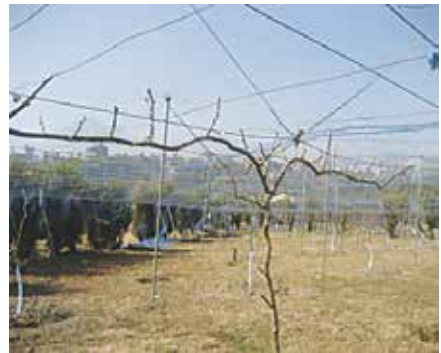
काँटछाँट गरे पछि