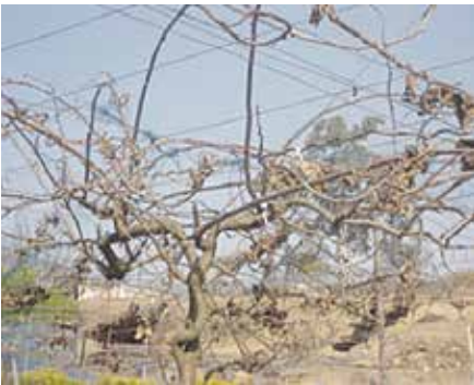
काँटछाँट गर्नु अघि